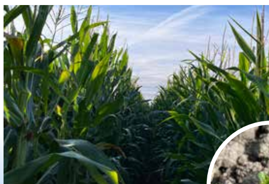
Majsen ser ut att bli bra, i höstrapsen har man sett angrepp av rapsjordloppa.

Det köps en hel del utrustning för precisionsodling vid nyinvesteringar och man planerar för styrfiler och liknande. I den mån man gör en större investering är det mycket övervägande innan man bestämmer sig.