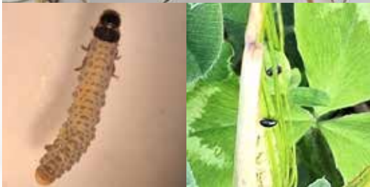
Korn- och stråjordloppor har skapat problem på Gotland.