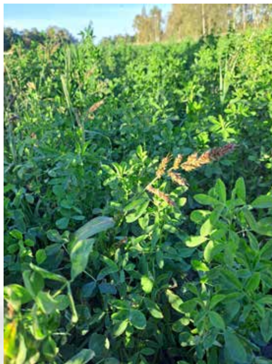
Ovan: Hönshirs i vall. Nedan: Vitblära.

Hushållningssällskapet Gotland arbetar i projektet ”Hållbart vatten för framtiden” för att öka sin egen och kundernas kompetens om hantering av vatten. De låga skördarna i år skapar en viss pessimism bland lantbrukarna, som säkert påverkar investeringsviljan. Men det kan kanske sporra vissa att investera för att trygga framtida skördar.