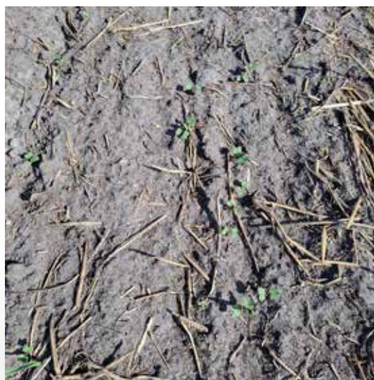
Dålig uppkomst i höstraps i och med torra.