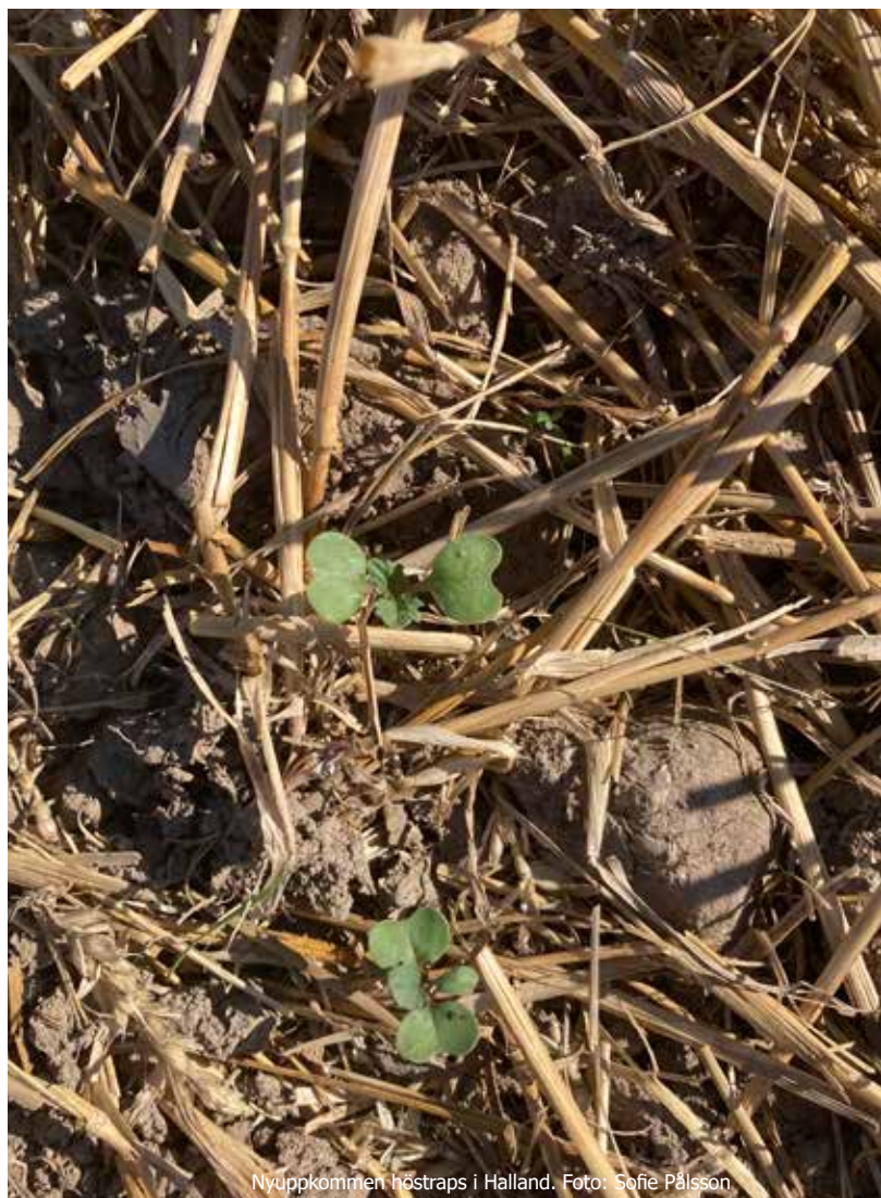
Nyuppkommen höstraps i Halland.

jordbearbetning. Det verkar bli stor andel höst-sådda grödor, en del har valt att odla på tidigare trädor då det finns ett undantag från trädeskravet även 2023.