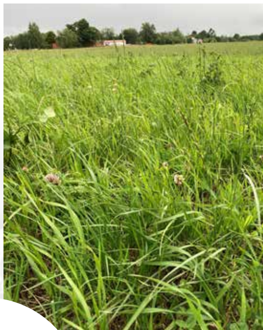
Gles vallåterväxt.

Förstaskörden gav 50 till 100 procent av normalskörd, beroende på nederbörds mängder. Även om grödan var tät, blev det ingen ordentlig längd på den eftersom grödan tog stryk av kylan i våras. Andraskörden borde varit igång för en vecka sedan, men i många fall finns det inte mycket att slå utan man hoppas på en bra tredjaskörd istället. Man förväntar sig halmbrist, dels eftersom många tagit helsäd, dels på grund av kortare strån.