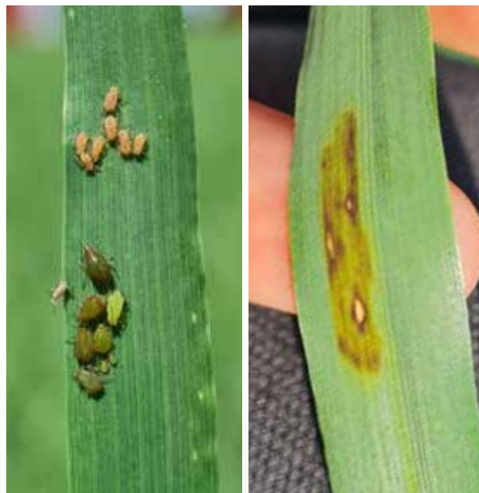
Till vänster: Havrebladlus och sädesbladlus på vårkorn, 28 juni 2023. Till höger: Sköldfläcksjuka på vårkorn, 28 juni 2023.

– Det fanns bra lager från 2022 då grovfoderskörden var 20 till 30 procent högre än normalskörden. Förstaskörden i år blev lägre än normalt, men hög TS-halt och god kvalitet kan kompensera. Regnet som kom, kommer att gynna andraskörden och det ska bli spännande att hur de stora regnmängderna påverkar.