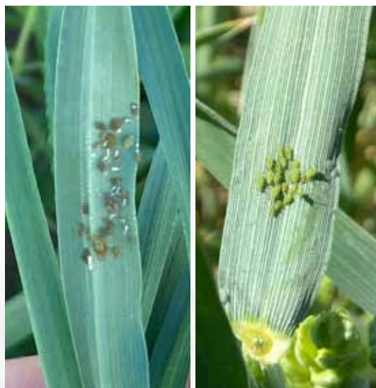
Till vänster: Havrebladlöss vårspannmål, Blekinge. Till höger: Sädesbladlöss höstvete, Blekinge.

Majsen ser hyfsad ut, trots att ogräsen påverkar. Förmodligen kommer den att "explodera" nu efter regnet. Man ser även att både beten och vallar har grönskat efter regnet.