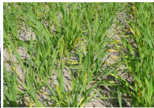
Torkpåverkat korn, Norrbotten vecka 25.

Halmbristen känns mer akut då man brukar köpa mycket halm från södra Sverige där torkan kommer att orsaka halmbrist. Det känns oroligt. De spannmålsfält som finns här verkar inte heller producera mycket halm då stråna är mycket korta.