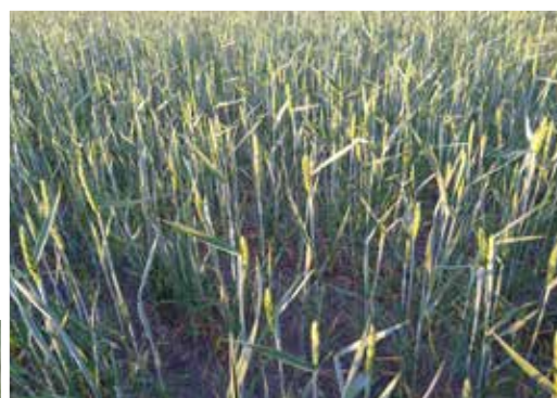
Torkstressat vårvete, Hälsingland 2023.

På grund av torkan är det betesbrist i området och man har fått stödutfodra med lager från förra året. Tack vare regnet hoppas man på god återväxt och en hög andraskörd och även att betena ska producera.