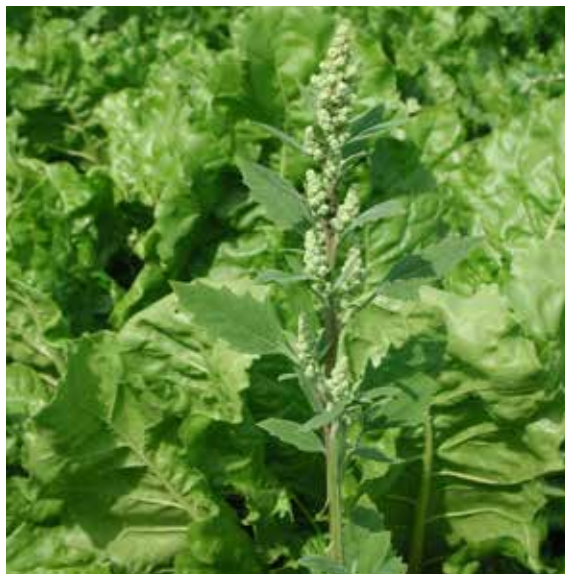
Över: Svinmålla i sockerbeter. Under: Torkskadat vete.

Svamptrycket har varit väldigt lågt, däremot har det varit stora angrepp av bladlöss och andra insekter. De flesta lantbrukarna i området har bekämpat bladlöss i vårkorn och sockerbeter. I sockerbeterna har det varit problematiskt med ogräsbekämpningen eftersom en av de vanligaste herbiciderna, Goltix, är av typen jordherbicid som fungerar dåligt när det är torrt. Det har gjort att man nu börjar se en del mållor i sockerbetsfälten. Majsen ser fin ut, den gillade den varma starten.