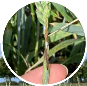
Angrepp av Kornfluga, Halland 2023. Vårveten får två axnivåer vid angrepp av kornflugan - angripna ax går inte ur holk.

Det har inte blivit någon andraskörd alls, utan man hoppas på en bra tredjaskörd. Det är även en del insådder som gått ut på grund av torkan, framförallt på de lättare jordarna. För att ersätta dessa har man i en del fall sått nya insådder i den spannmål som såtts senare, för helsäd. I området har man även slagit mycket skyddszoner och trädor, även detta för att kompensera för den dåliga förstaskörden. De halländska lantbrukarna hoppas på mer regn.