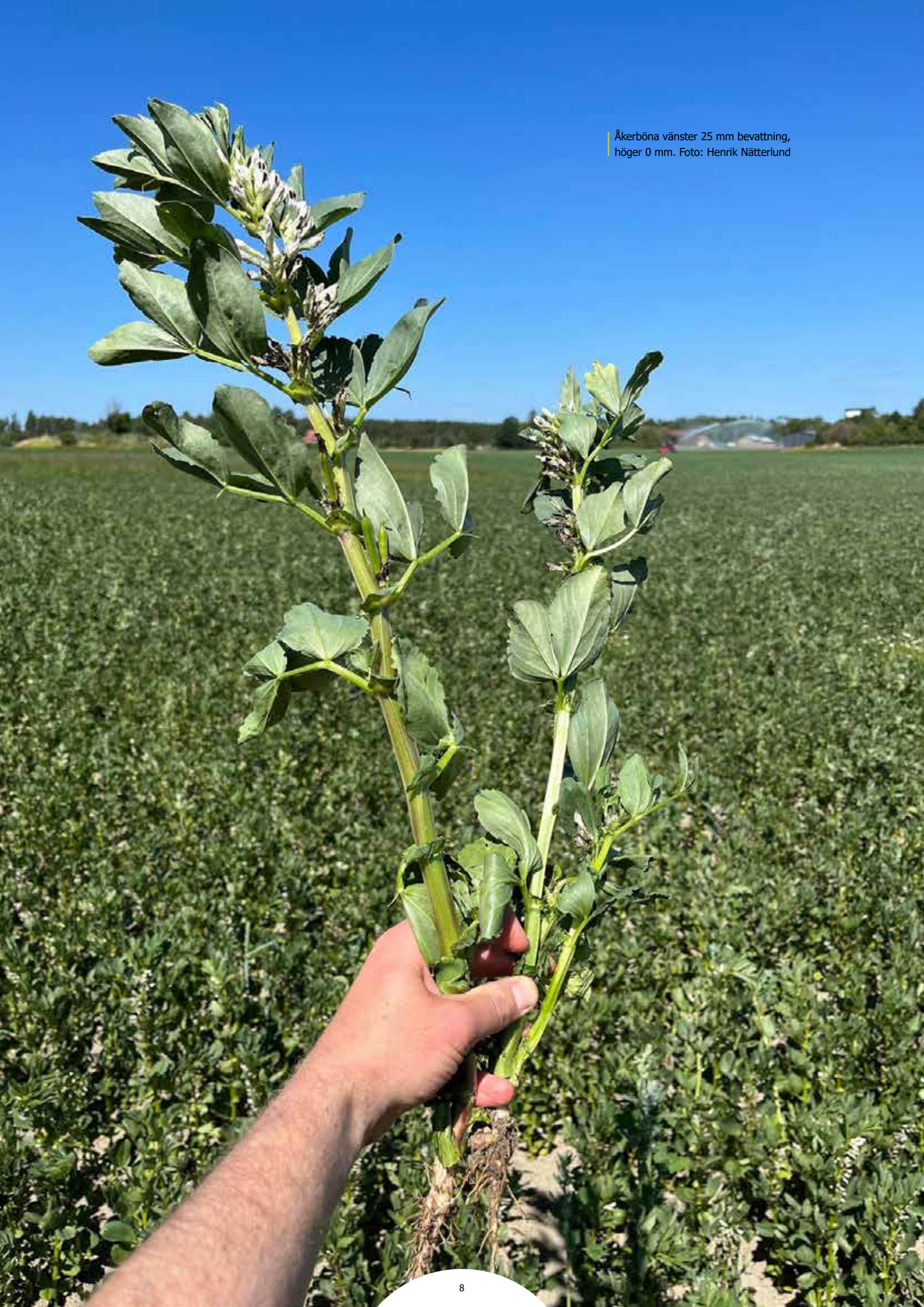
Åkerböna vänster 25 mm bevattning, höger 0 mm.